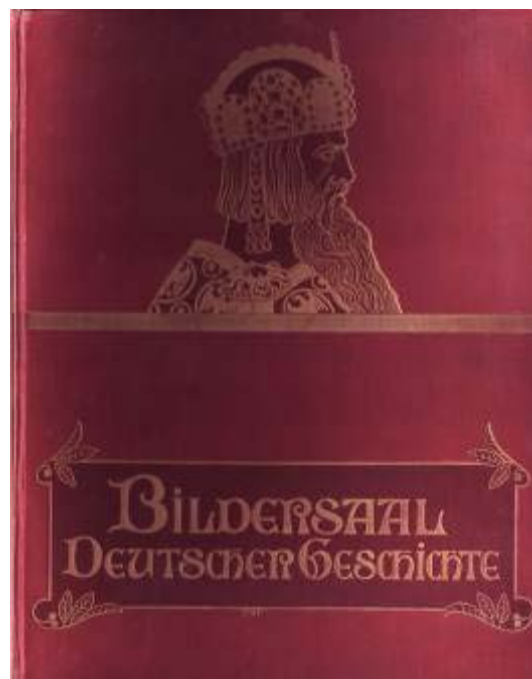
Umschlag des Buches „Bildersaal Deutscher Geschichte“.

Besonders populär wurde der „Bildersaal Deutscher Geschichte“, der 1890 erstmals erschien und bis in die 30er Jahre des 20. Jahrhunderts immer wieder aufgelegt wurde.