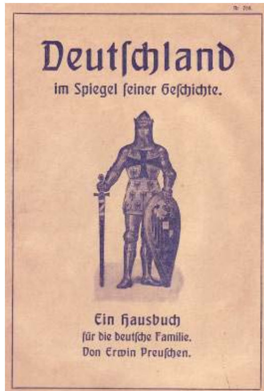
Umschlag des Buches „Deutschland im Spiegel seiner Geschichte. Ein Hausbuch für die deutsche Familie“.

Besonders populär wurde der „Bildersaal Deutscher Geschichte“, der 1890 erstmals erschien und bis in die 30er Jahre des 20. Jahrhunderts immer wieder aufgelegt wurde.