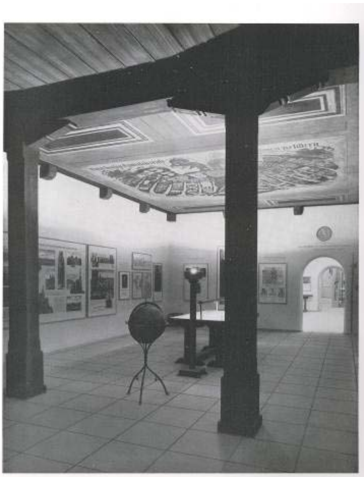
„Vorreformation – Reformation – Bauernkriege“ aus dem Katalog zur Ausstellung „Deutsche Größe“, S. 39.