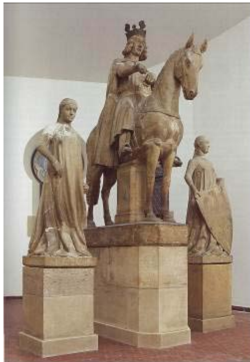
Magdeburger Reiter mit Schild- und Lanzen- trägerinnen, Kulturhistorisches Museum Magdeburg

Erst unter Kaiser Friedrich III. trat in der zweiten Hälfte des 15. Jahrhunderts der Zusatz „Deutscher Nation“ hinzu, der eher als eine Verengung, um nicht zu sagen eine Rücknahme des Universalanspruchs des Heiligen Römischen Reiches verstanden wurde. Dennoch schuf das deutsche Mittelalter starke Geschichtsbilder, als Beispiel können wir den Bamberger und den Magdeburger Reiter oder den Codex Manesse – das große Buch der Minne – nennen, in denen Persönlichkeiten des frühen bzw. hohen Mittelalters eindrucksvolle Denkmäler gesetzt wurden.