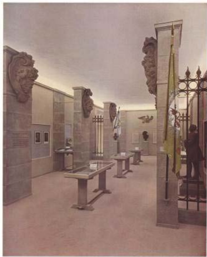
AUSSTELLUNG -DEUTSCHE GRÖSSE- RAUM -PREUSSEN UND DAS REICH- LICHTBILD FRIEDRICHSTADT 1913/14