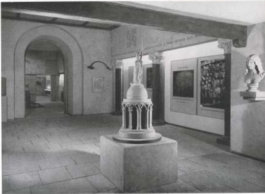
„Die Germanenreiche“ aus dem Katalog zur Ausstellung „Deutsche Größe“, S. 36.

eine Geschichte, die – zusammen mit dem erneuerten Anspruch Deutschlands auf die Führungsrolle in Europa – im „Dritten Reich“ gipfelte.