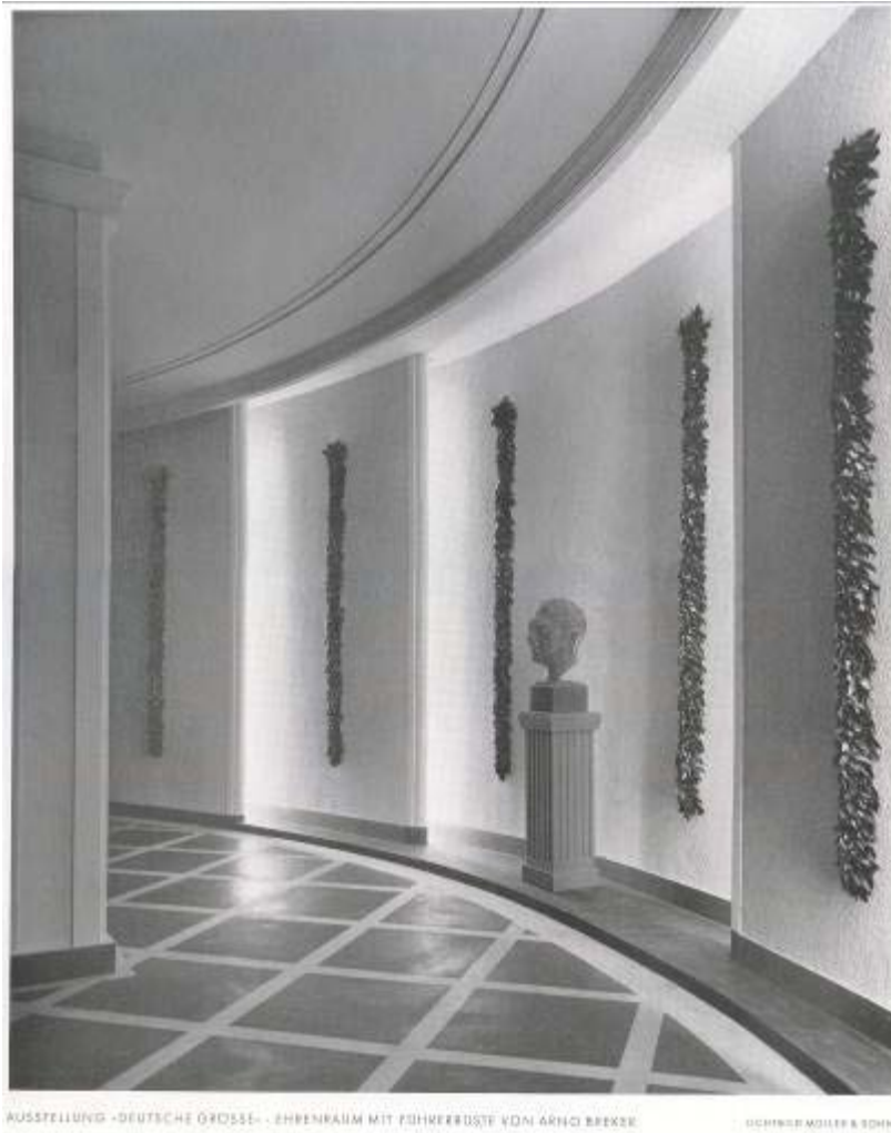
„Ehrenraum mit Führerbüste von Arno Breker“ aus dem Katalog zur Ausstellung „Deutsche Größe“, S. 41.

Nach dem Zweiten Weltkrieg entwickelte sich das Geschichtsbild in den beiden deutschen Staaten sehr unterschiedlich. In der DDR wurde die Geschichte zum Instrument der marxistisch-leninistischen Ideologie und sollte den Beweis antreten, dass sich der Historische Materialismus – wonach die Geschichte im Wesentlichen eine Geschichte von Klassenkämpfen ist und auf ihrer letzten Entwicklungsstufe die kommunistische und damit klassenlose Gesellschaft hervorbringt – erfüllte. Heute etwas anachronistisch anmutend griff man dabei auf das Mittel der Historienmalerei zurück.