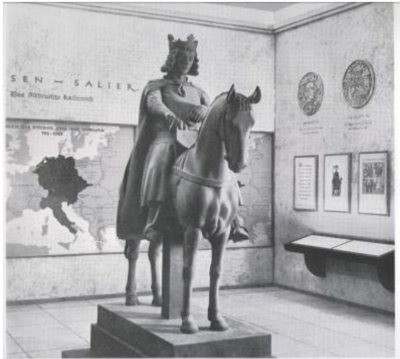
„Das Altdeutsche Reich: Die Zeit der Sachsen und Salier“ aus dem Katalog zur Ausstellung „Deutsche Größe“, S. 40.