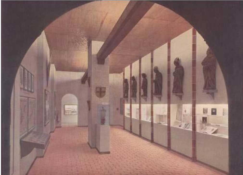
„Der deutsche Orden, Hanse und Deutschritterorden“ aus dem Katalog zur Ausstellung „Deutsche Größe“, S. 38.