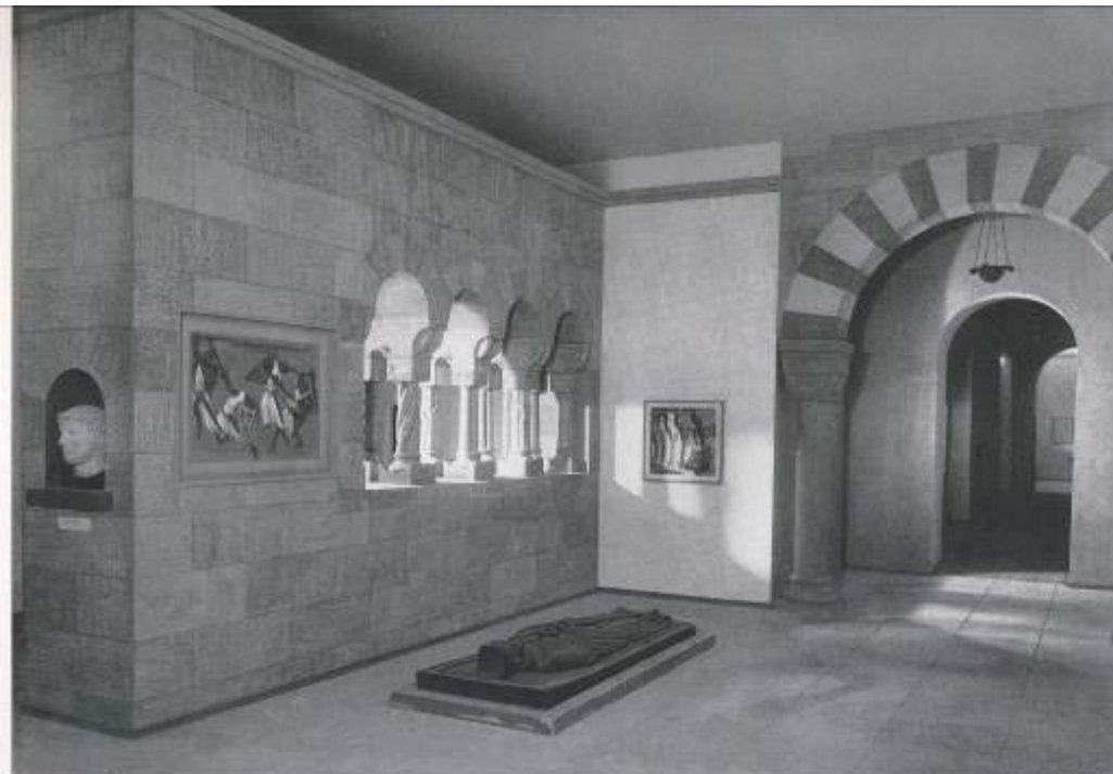
„Das Altdeutsche Reich: Die Zeit der Staufer“ aus dem Katalog zur Ausstellung „Deutsche Größe“, S. 39.