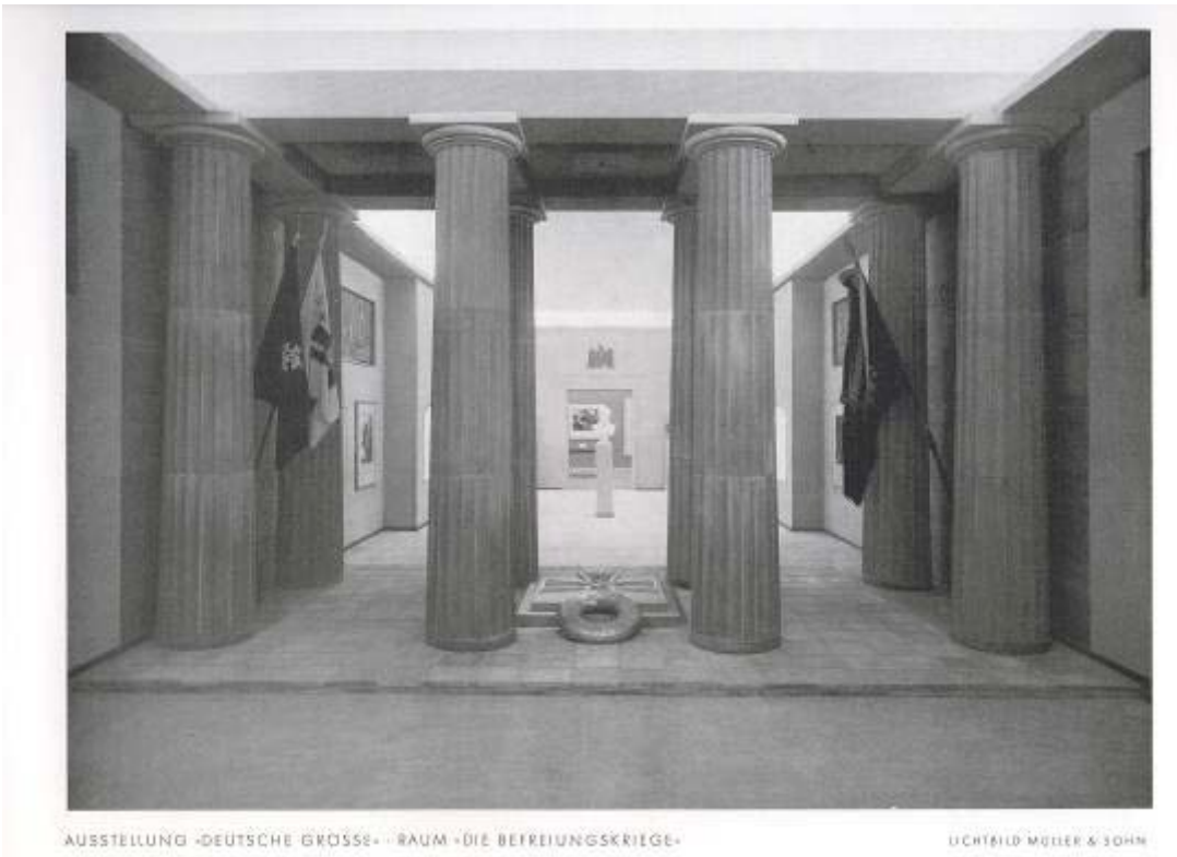
AUSSTELLUNG -DEUTSCHE GRÖSSE- RAUM -DIE BEFREIUNGSKRIEGE-