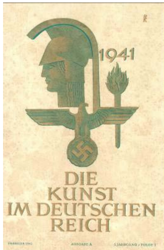
Deckblatt der Schrift „Die Kunst im Deutschen Reich“.

Auf dem Höhepunkt der nationalsozialistischen Machtentfaltung organisierte das Amt Rosenberg die Ausstellung „Deutsche Größe“. Die mit Abstand erfolgreichste historische Ausstellung im „Dritten Reich“ bot eine Gesamtdarstellung des nationalsozialistischen Geschichtsbildes und arbeitete mit modern anmutenden inszenatorischen Mitteln. Die Ausstellung „Deutsche Größe“ wurde am 8. November 1940 im Deutschen Museum München eröffnet und später noch an fünf weiteren Orten vor insgesamt 657.000 Besuchern gezeigt.